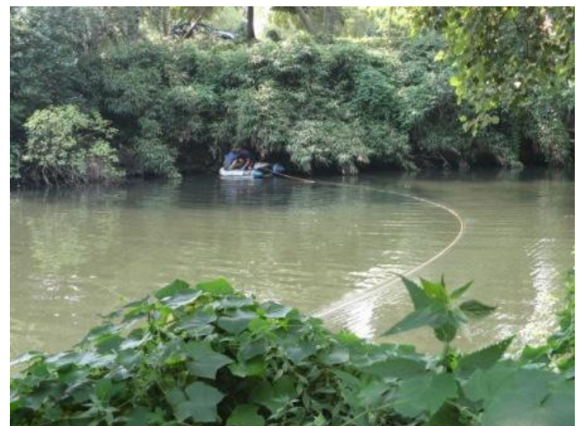
Foto a suolo della zona di campionamento

fisici chimici finger-print ecotossicologici macroinvertebrati bioaccumulo