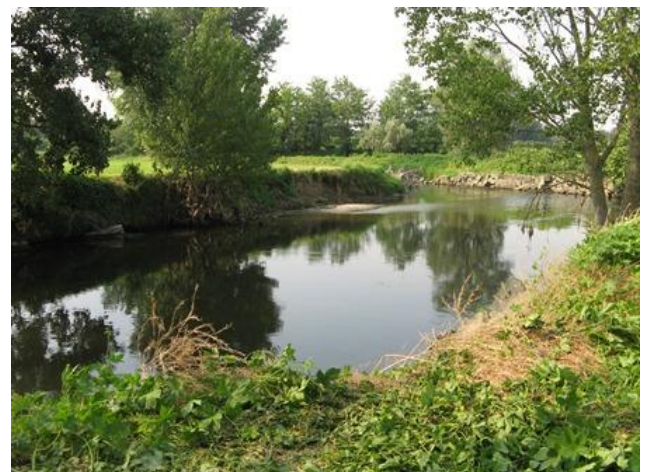
Foto a suolo della zona di campionamento