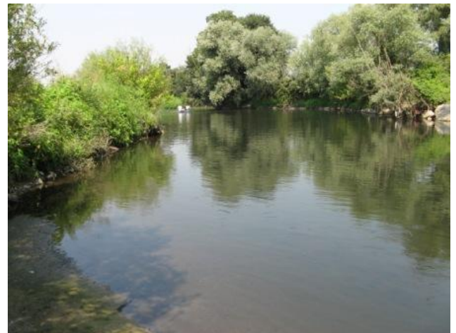
Foto a suolo della zona di campionamento