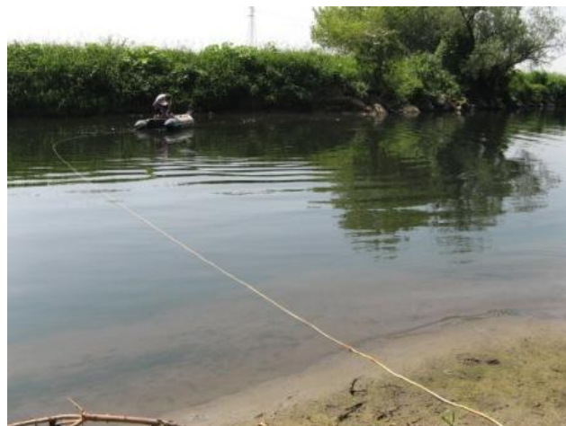
Foto a suolo della zona di campionamento