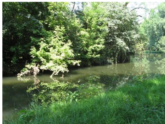
Foto a suolo della zona di campionamento