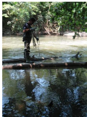
Foto a suolo della zona di campionamento

fisici chimici finger-print ecotossicologici macroinvertebrati bioaccumulo