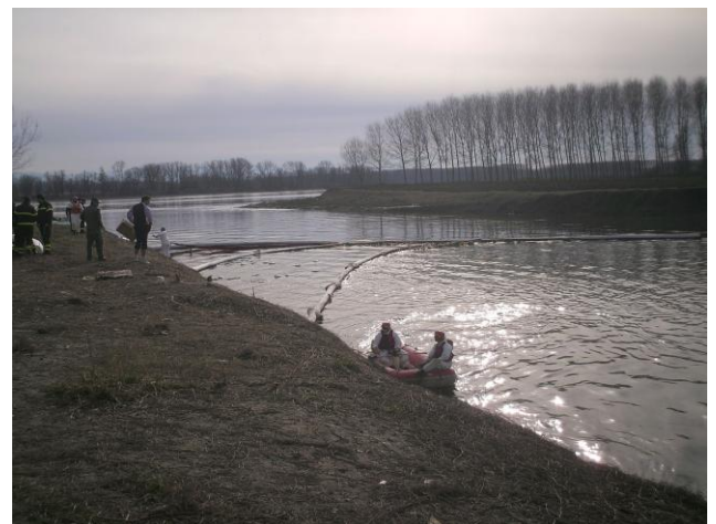
Foto a suolo della zona di campionamento