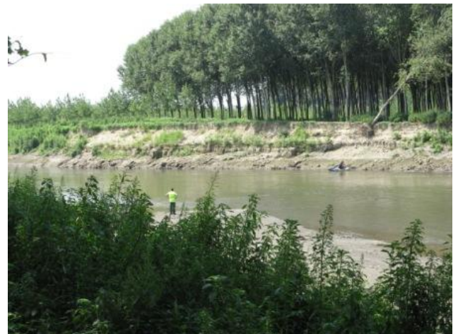
Foto a suolo della zona di campionamento

fisici chimici finger-print ecotossicologici macroinvertebrati bioaccumulo