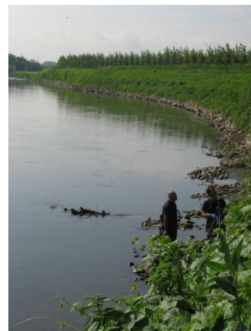
Foto a suolo della zona di campionamento

fisici chimici finger-print ecotossicologici macroinvertebrati bioaccumulo