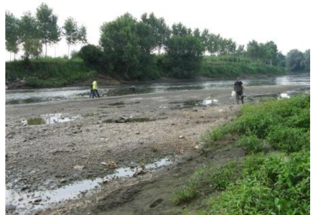
Foto a suolo della zona di campionamento

fisici chimici finger-print ecotossicologici macroinvertebrati bioaccumulo