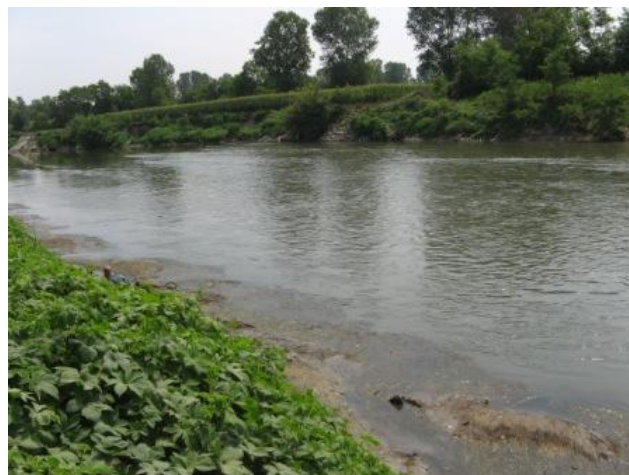
Foto a suolo della zona di campionamento

fisici chimici finger-print ecotossicologici macroinvertebrati bioaccumulo