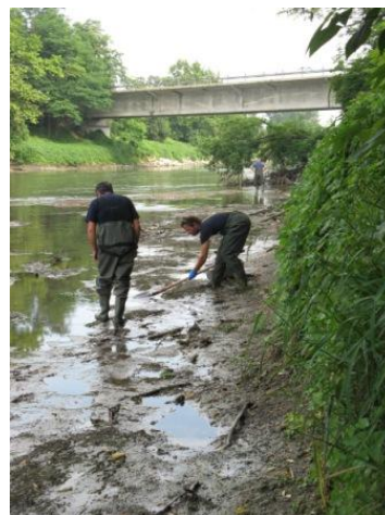
Foto a suolo della zona di campionamento

fisici chimici finger-print ecotossicologici macroinvertebrati bioaccumulo