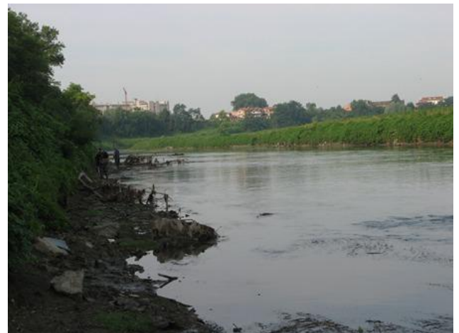
Foto a suolo della zona di campionamento