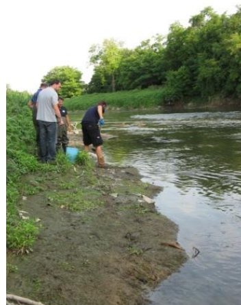
Foto a suolo della zona di campionamento

fisici chimici finger-print ecotossicologici macroinvertebrati bioaccumulo