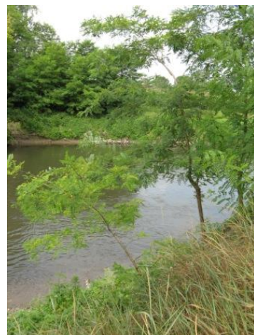
Foto a suolo della zona di campionamento

fisici chimici finger-print ecotossicologici macroinvertebrati bioaccumulo