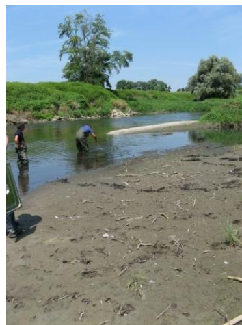
Foto a suolo della zona di campionamento