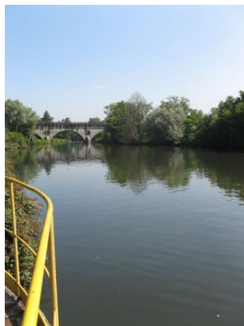
Foto a suolo della zona di campionamento

fisici chimici finger-print ecotossicologici macroinvertebrati bioaccumulo