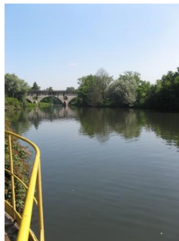
Foto a suolo della zona di campionamento

fisici chimici finger-print ecotossicologici macroinvertebrati bioaccumulo